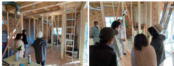
測定の様子を見学するお施主様・お客様