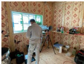
測定をしてくれている業者様