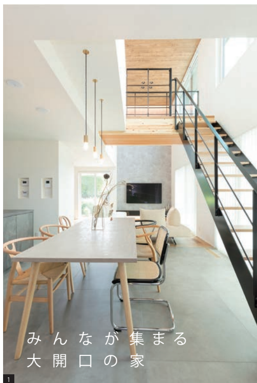
みんなが集まる 大開口の家